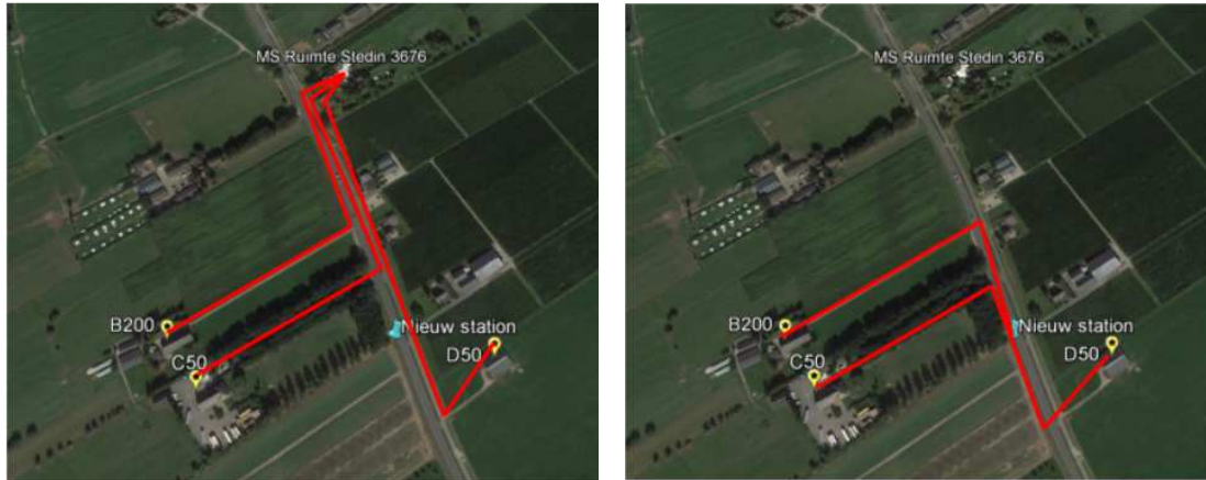
Figuur 3: Fictief voorbeeld zonnedaken - scenario business as usual (links) versus 'anders aansluiten' (rechts)

Voor zonnepanelen op (agrarische) daken is een vergelijkbare exercitie gedaan door Stedin. Hier is een fictief voorbeeld uitgewerkt van 3 zonnedaken die een grootverbruik-aansluiting vergen. Bij de huidige wijze wordt voor elk dak een kabel naar het dichtstbijzijnde middenspanningsstation getrokken. In het alternatieve scenario komt er een nieuw middenspanningsstation dat meer centraal ligt ten opzichte van de 3 daken.