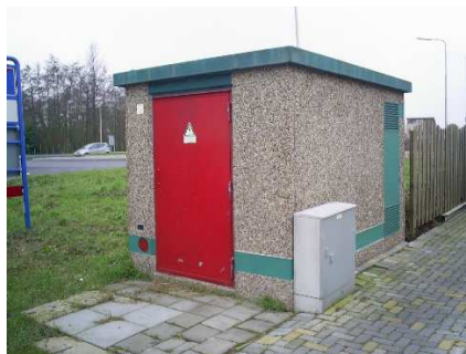
10kV station (Middenspanningsruimte)