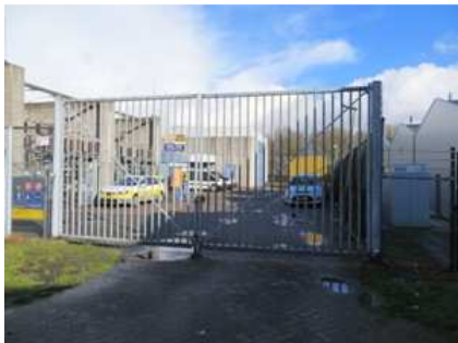
50/10 kV station (Transformatorstation)